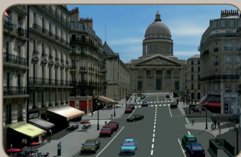
Illustration du project Terra Dynamica